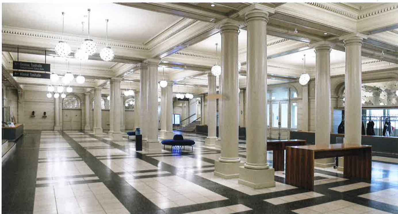
Das Tonhalle-Vestibül wurde mit wässriger Leinöl-Emulsionsfarbe beschichtet.

Das von der Firma Kuhn entworfene Orgelgehäuse wurde in Zusammenarbeit mit den Architekten sowie der Denkmalpflege sorgfältig auf die Formensprache des Saals abgestimmt. Im Einklang mit dem Grundkonzept für den grossen Tonhalle-Saal bildeten die Maler Holzstrukturen in Maserierungstechnik mit einer Holzlasur auf Leinölbasis nach. Die Eichen-Maserierung wurde so angepasst, dass sie sich nahtlos in das Gesamtbild einfügt