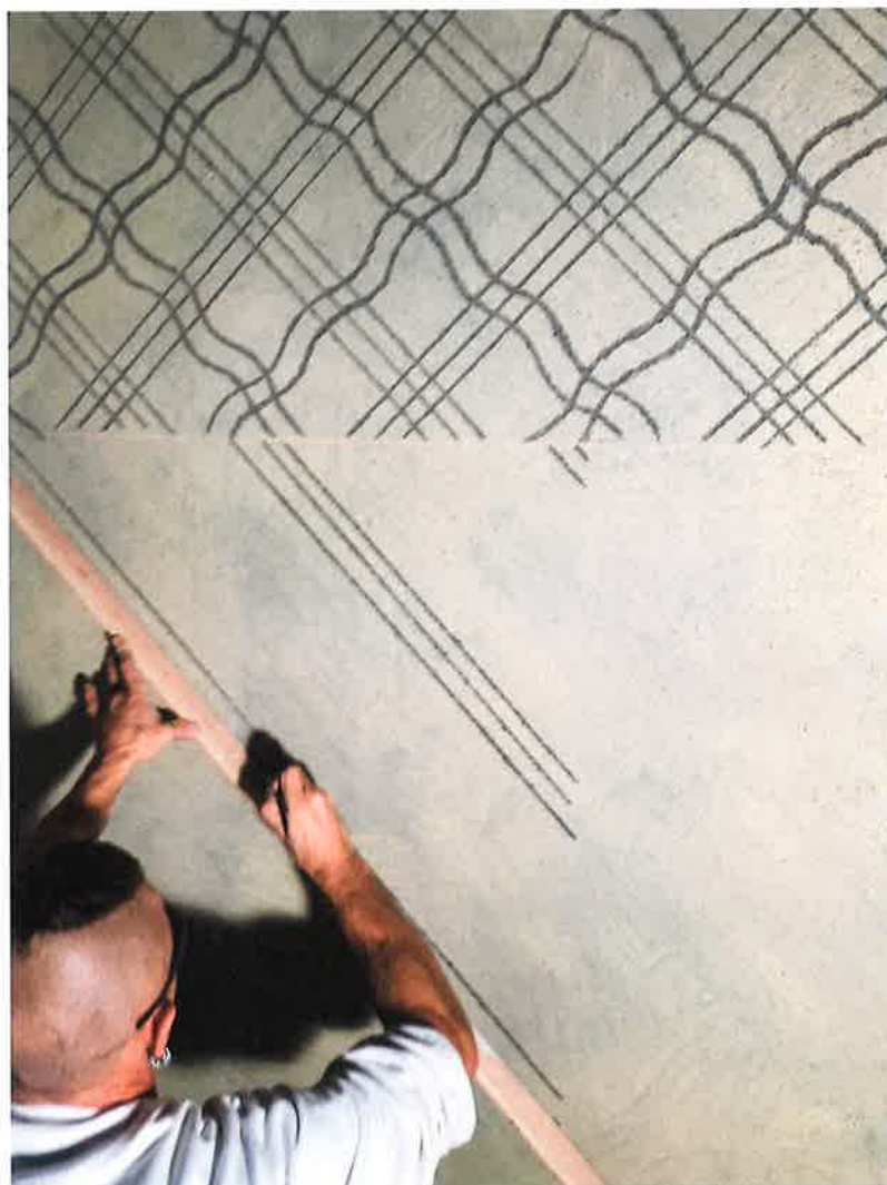
Das rund 1400 Quadratmeter grosse Sgraffito wurde, wo nötig, rekonstruiert.

Die Stadt Zürich – als Geldgeberin der Kongresshaus-Stiftung, der Eigentümerin des Gebäudekomplexes – bestand auf lösungsmittelfreien Produkten. Deswegen kamen eine wässrige Ölfarbe für die Wände, Säulen und Deckenunterzüge und eine komplett reversible Leimfarbe zum Einsatz.